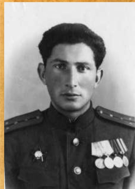
Волчек Наум Давидович