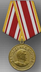
Медаль «За победу над Японией» 1945г