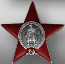
Орден Красной Звезды 1945г.