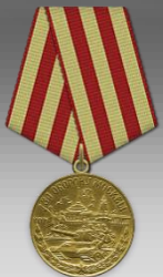
Медаль «За оборону Москвы» 1944г.