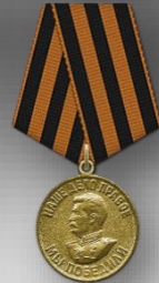
Медаль «За победу над Германией в Великой Отечественной войне 1941–1945 гг.» 1945г.