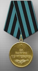
Медаль «За взятие Кёнигсберга» 1945г